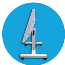
Регулировка уровня высоты