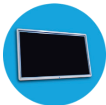
Возможность крепления на стену