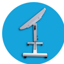
Выбор угла наклона экрана