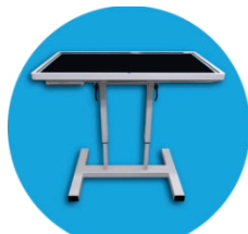
Режим "интерактивный стол"

Windows привычная пользователю операционная система, офисный пакет программ и антивирус.