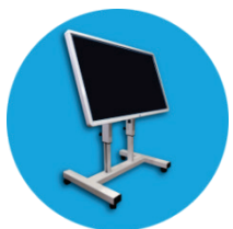
Мобильная вертикальная стойка